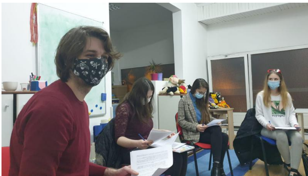
Sastanak s volonterima na projektu „Društveno uključena romska zajednica na području zagrebačke Peščenice“

Iz navedenog je vidljivo kako su svi postavljeni ciljevi u većoj mjeri ostvareni. Dakle, procijenjeno je da roditelji jesu ojačali svoje roditeljske vještine, da su povezaniji sa zajednicom, odnosno da su informirani kako tražiti i dobiti pomoć u zajednici. Za djecu je procijenjeno da su povećali svoje samopouzdanje i određene vještine te da su poboljšali svoje vještine učenja te donekle i školski uspjeh. No, ono što je dodana vrijednost projekta, a izrazito važna jer ovim obiteljima nisu zadovoljene osnovne egzistencijalne potrebe, su brojne akcije nastale u sklopu projekta, a kojima se nastojalo prikupiti donacije za te obitelji. Uloženo je ukupno 78 sati rada za navedene akcije .